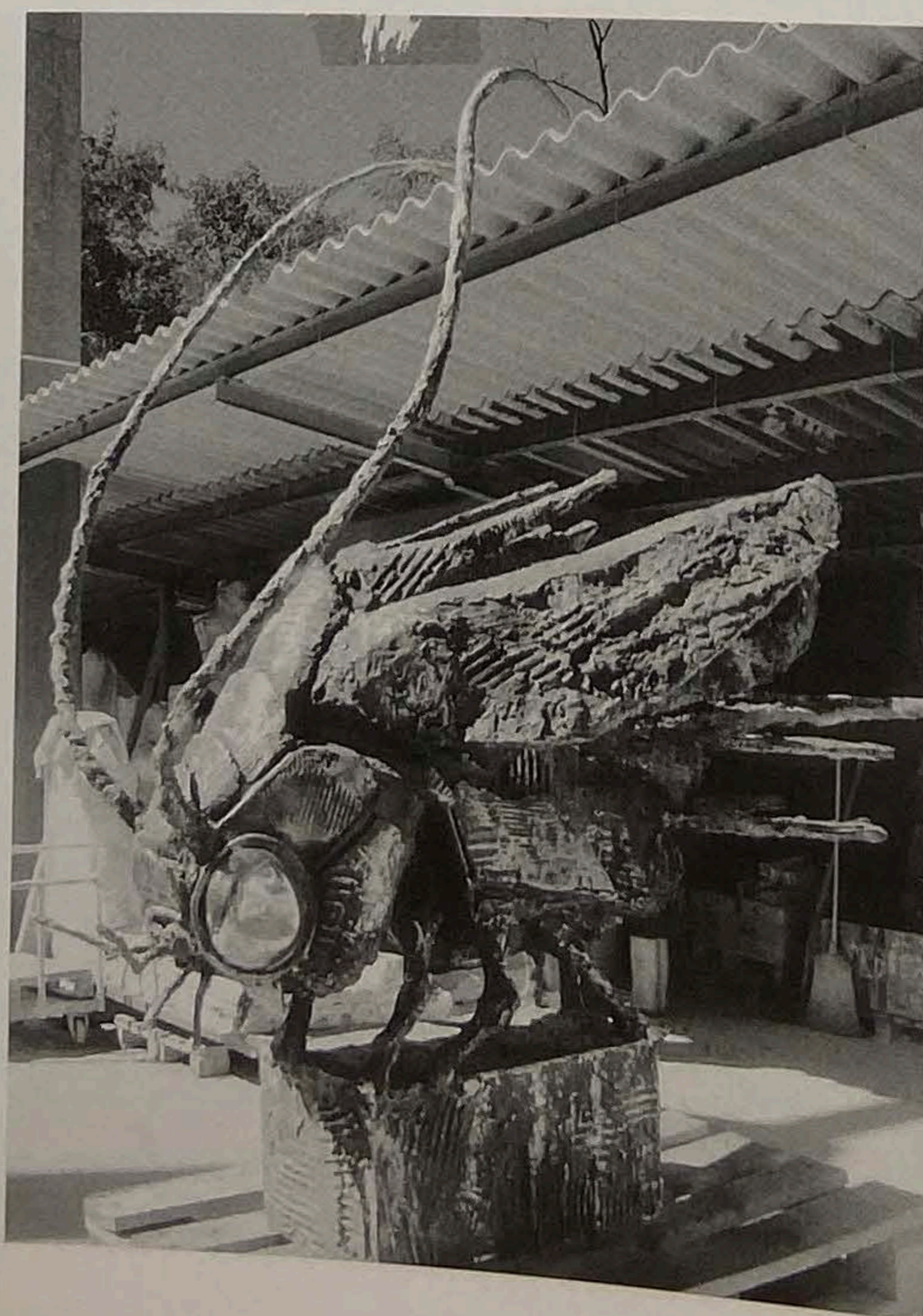
Moscone 2007-2008 Bronze H 177, B 200, T 80